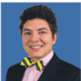
Philippe de Candolle Chêne-Bourg