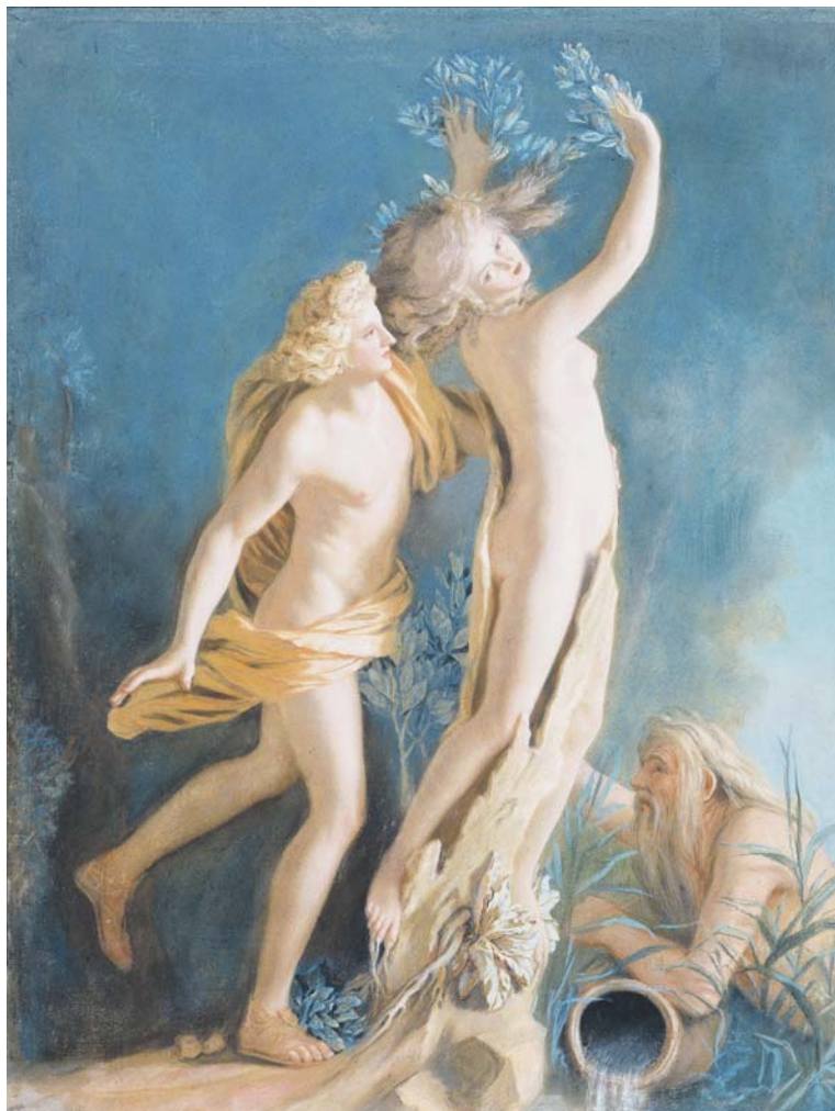
Jean-Étienne Liotard, Apollon et Daphné (d'après Le Bernin), pastel sur papier, 1736, Amsterdam, Rijksmuseum, SK-A-1195

Jouxtant la mairie du côté du parc François-Auguste-Châtrier, une œuvre singulière mais discrète interroge le rapport de l'art à la nature.