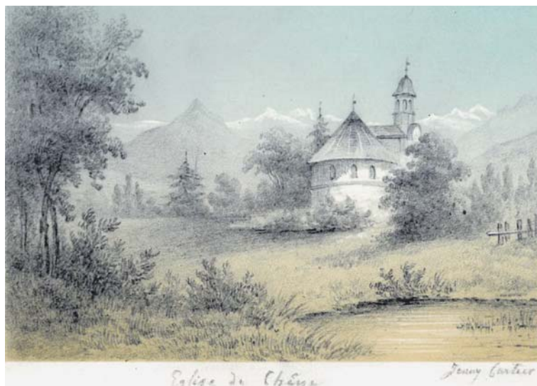
Jenny Cartier, Chêne-Bougeries, paysage avec le temple , dessin, 2 e moitié du XIX e siècle. Bibliothèque de Genève, N° d'inventaire 2017 008 e

L'arrivée des époux constitue un véritable rituel public: « Les époux – ils étaient venus à pied comme tous les gens de la noce – sont accueillis par des acclamations ». Cette simplicité des déplacements rappelle le caractère modeste et rural de la société chênoise