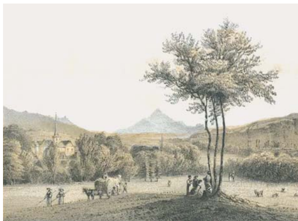
Samuel Morel (éditeur), Chêne et le Mont-Blanc (environ de Genève) , estampe, milieu du XIX e siècle. Bibliothèque de Genève, N° d'inventaire 35P Ch Bour 01.

Chêne-Thônex réunit des réalités sociales très contrastées. D'un côté, les bourgs de Chêne et de Moillesulaz, le long de l'actuelle rue de Genève, connaissent une vie animée, rythmée par le passage de chars et de voyageurs. On y trouve commerçants, artisans, et professions libérales. De l'autre, les hameaux de Thônex, Fossard et Villette restent profondément ruraux, même si certaines grandes familles y possèdent d'importantes propriétés foncières. Cette opposition spatiale se double rapidement d'un clivage politique et culturel. Les habitants des bourgs, majoritairement favorables aux réformes économiques et politiques, se revendiquent radicaux. Les paysans des hameaux, attachés aux coutumes anciennes, sont perçus, voire caricaturés comme conservateurs.