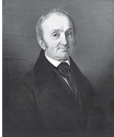
Joseph Hornung, Portrait de John Petit-Senn , 1844 (conservé à la BGE).

Le territoire même des Trois-Chêne, alors encore très largement campagnard, ne compte pas pour peu dans